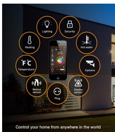
System Smart Home Loxone

PROJEKT 1 to firma rodzinna. Powstała w 2013 roku i realizuje własne projekty inwestycyjne obejmujące całość procesu deweloperskiego – począwszy od pozyskania gruntów, projektowania, budowę, aż do sprzedaży. Budujemy zorganizowane osiedla domów jednorodzinnych oraz kameralne budynki wielorodzinne.