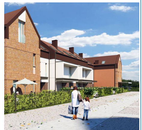
Ul. Masłowiecka 18, Warszawa Wawer